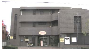
分園こぐまっこ(0・1歳児)