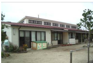
東園舎(3・4・5歳児、支援センター)