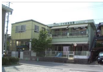
西園舎(0・1・2歳児、一時保育)

児童の年齢、保護者の所得税額及び市県民税の課税状況をもとに、刈谷市が決定します。